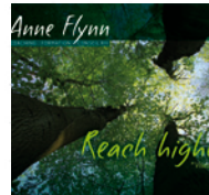
SITE ANNE FLYNN