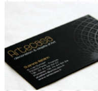
CARTE DE VISITE

DE LA CRÉATION DU LOGO À SA CHARTE GRAPHIQUE, ET SA DÉCLINAISON SUR DIFFÉRENTS SUPPORTS