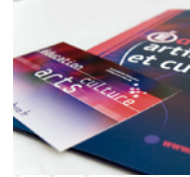
FLYER - CARTECOM

CONCEPTION, DIRECTION ARTISTIQUE, MISE EN PAGE