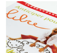
DOSSIER DE PRESSE