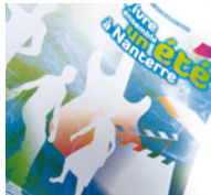
ILLUSTRATIONS / PHOTOS